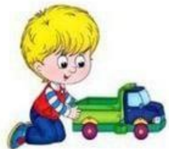
ИК-ИК-ИК Я катаю грузовик