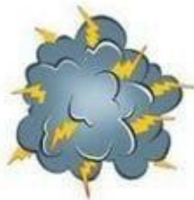
ЗА-ЗА-ЗА Начинается гроза