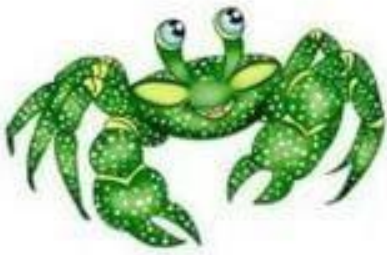
АБ-АБ-АБ Вот большущий краб