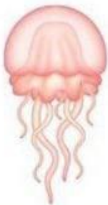
ЗА-ЗА-ЗА Прозрачная медуза