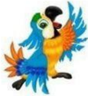
АЙ-АЙ-АЙ Говорящий попугай