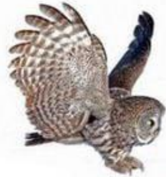
ВА-ВА-ВА К нам летит сова