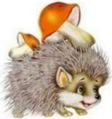
БЫ-БЫ-БЫ Ёж несёт грибы