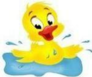
ДЕ-ДЕ-ДЕ Утенок плещется в воде