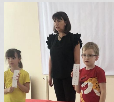
ИГРА РАСПОЗНАЙ СЛЕДЫ