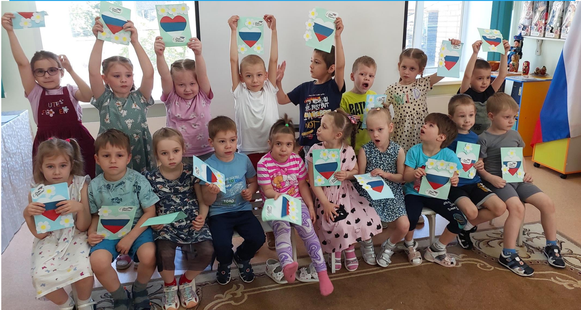
Группа «Золотой ключик»