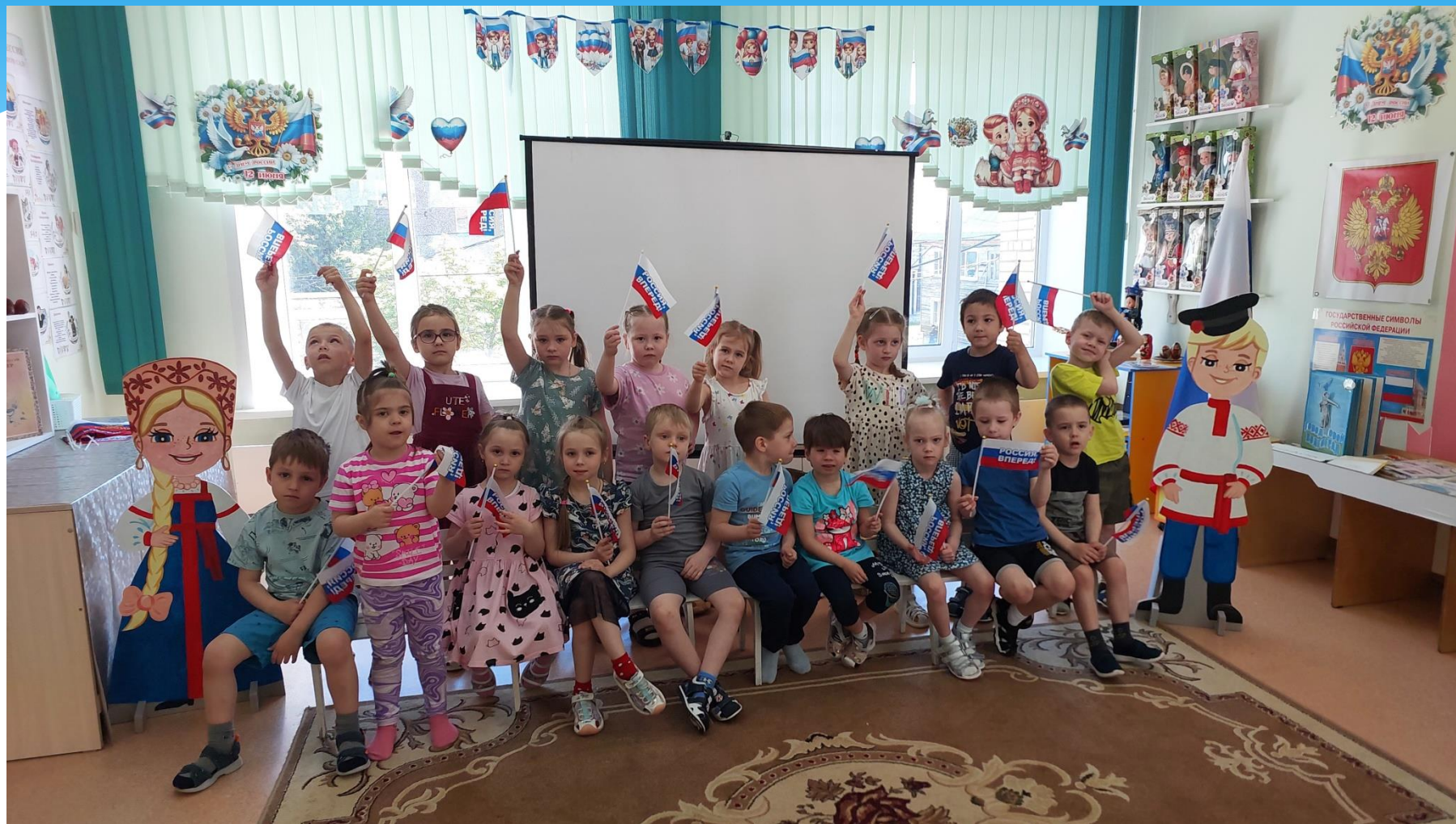
Группа «Золотой ключик»

Чтобы поздравить свою страну с праздником дети позируют с флажками создавая «живую открытку».