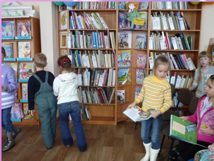
Экскурсии в библиотеку